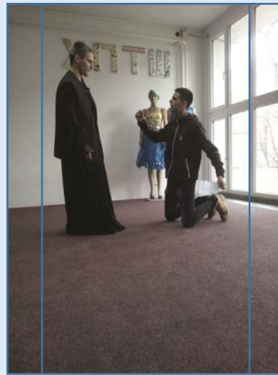
Делови из легенде “Свети Сава и властелин”