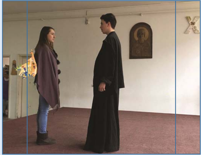
Делови из представе “Свети Сава и голубица”